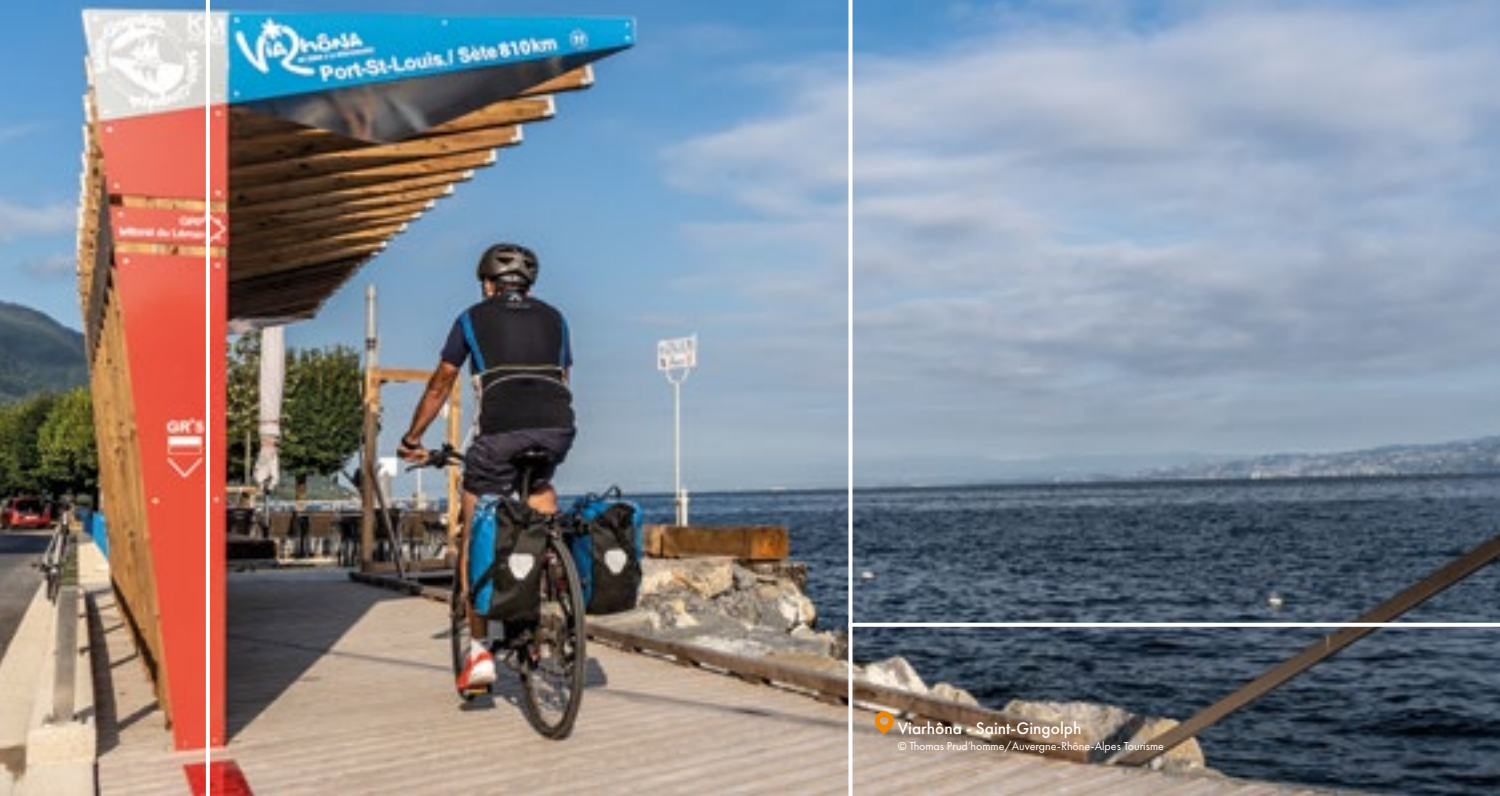
2023 - CARTE VELO - CYCLING MAP