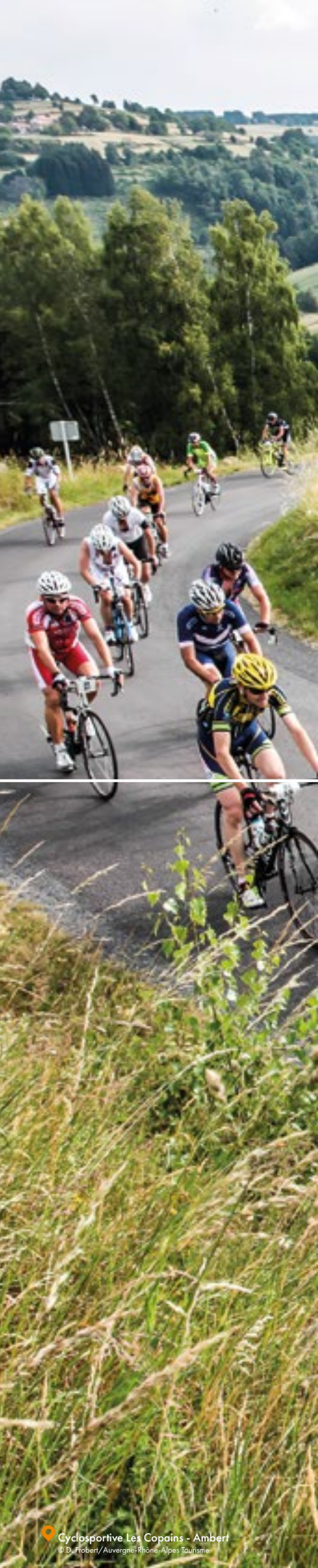
Depanneur Le Copain - Ambert

AUTRES ÈVÈNEMENTS : — Mai - Valence (Drôme) Raid VTT Les Chemins du Soleil raid-vtt.fr — Jun - Saint-Etienne-des-Oullières (Rhône) Tour du Beaujolais — Jun Critérium du Dauphiné critérium-du-dauphine.fr — Jun - Samoëns (Haute-Savoie) Vélovert Festival veloverfestival.com — Jun - Saint-Félicien (Ardèche) L'Ardèche, 30 e édition ardechoise.com — Juillet - Ambert (Puy-de-Dôme) Cyclo Les Copains cyclolescopains.fr — Augut Tour de l'Ain tourdelaain.com — Septembre - Blanzat (Puy-de-Dôme) Transvolcanique transvolcanique.com OTHER EVENTS: — May - Valence (Drôme) Raid VTT Les Chemins du soleil raid-vtt.fr — June - Saint-Etienne-des-Oullières (Rhône) Tour du Beaujolais — June Critérium du Dauphiné critérium-du-dauphine.fr — June - Samoëns (Haute-Savoie) Vélovert Festival veloverfestival.com — June - Saint-Félicien (Ardèche) L'Ardèche, 30 th edition ardechoise.com — July - Ambert (Puy-de-Dôme) Cyclo Les Copains cyclolescopains.fr — August Tour de l'Ain tourdelaain.com — September - Blanzat (Puy-de-Dôme) Transvolcanique transvolcanique.com